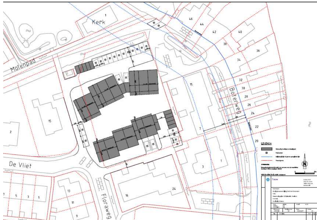
Figuur B3.1 Bouwplan CSV-locatie