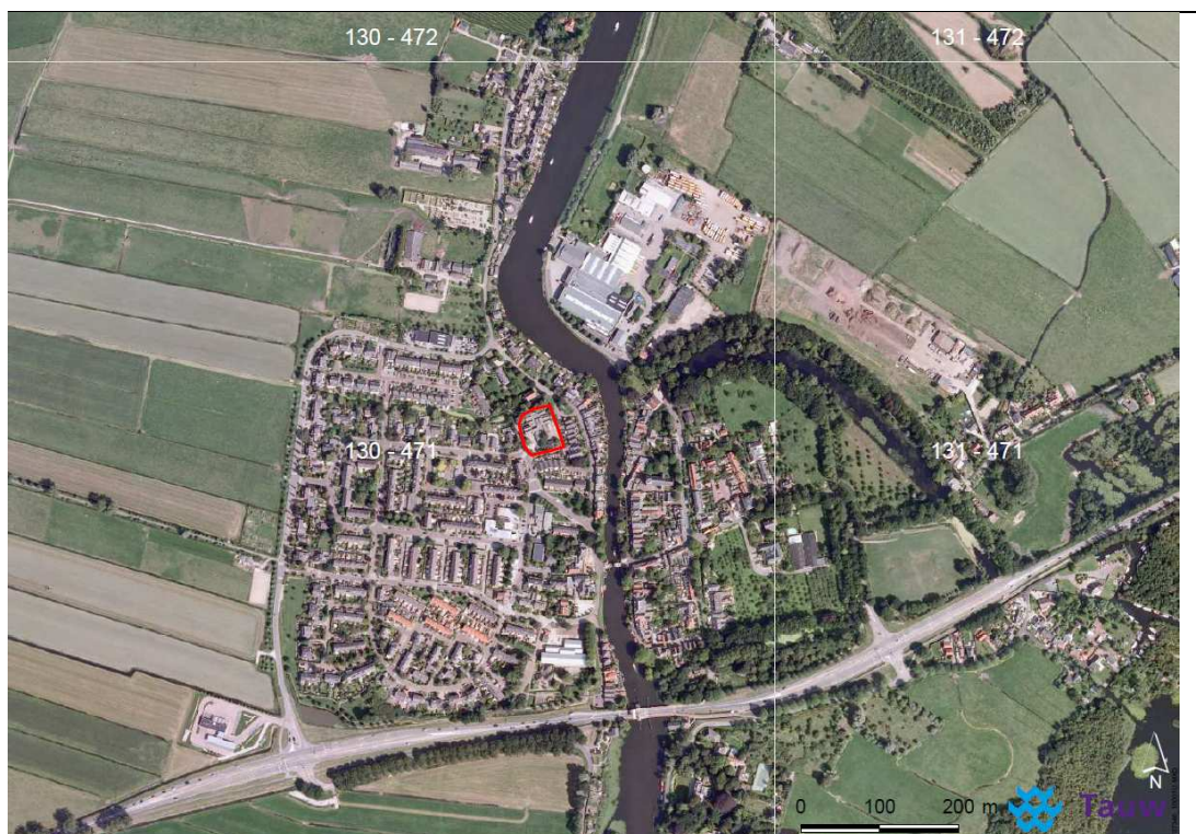
Figuur 2.1 Globale ligging van het plangebied (rode contour) in Vreeland.

Om (globale) locaties aan te duiden wordt in de ecologie veel gebruik gemaakt van een raster van kilometerhokken, zogenaamde RD-coördinaten. Verspreidingsgegevens van dier- en plantensoorten worden veelal per kilometerhok gedocumenteerd. Het plangebied ligt in kilometerhok 130 – 471. Onderstaande figuur 2.1 geeft de ligging van het plangebied en kilometerhokken weer.