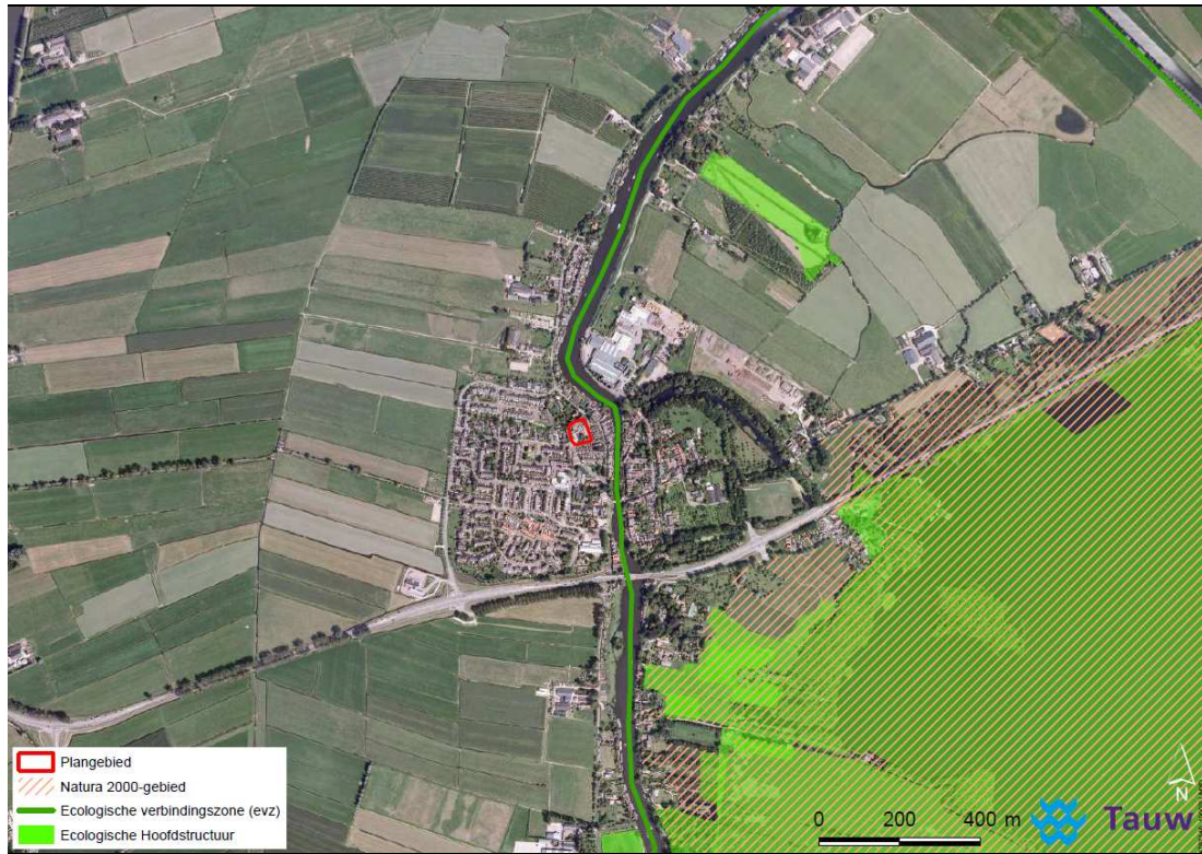
Figuur B1.1 overzicht van beschermde natuurgebieden in de omgeving van het plangebied