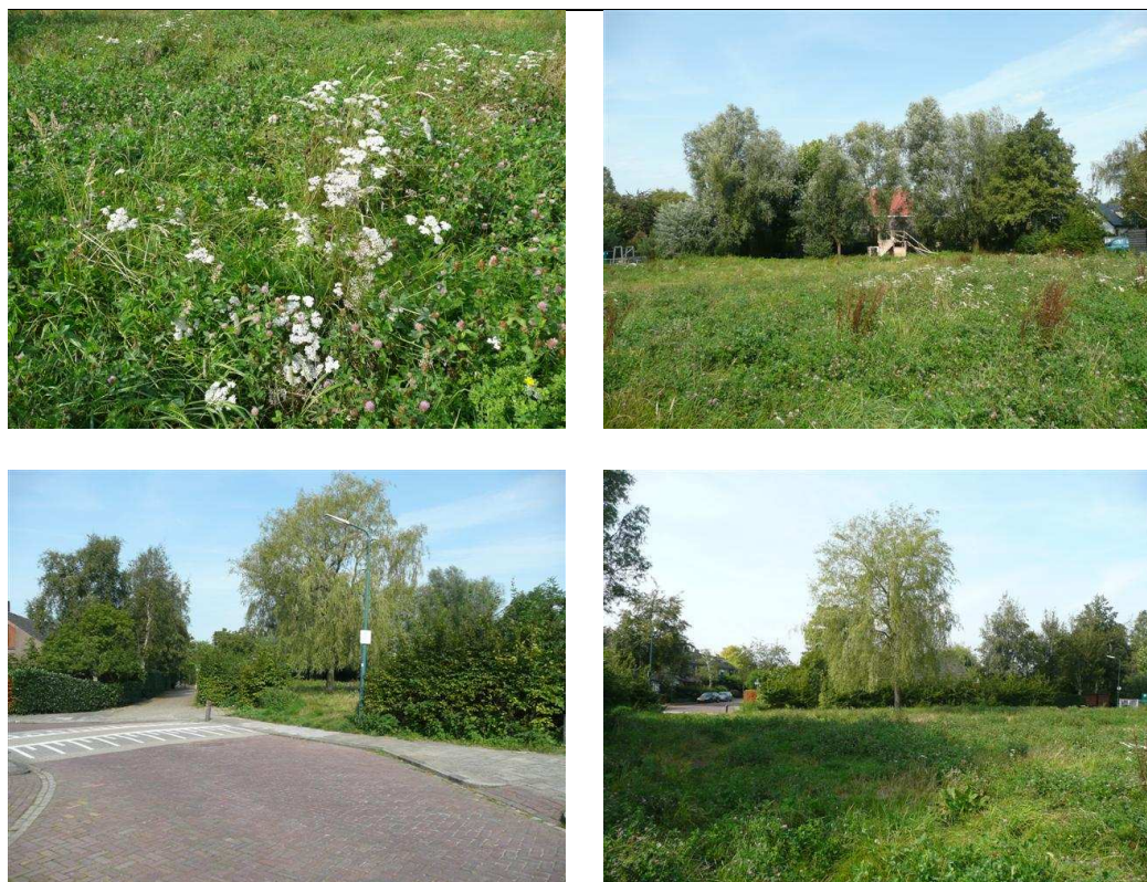
Figuur 2.2 Impressie van de huidige situatie in het (braak liggende) plangebied.

Deze quickscan wordt uitgevoerd op basis van de huidige situatie in het plangebied. Dit betekent dat er geen bebouwing aanwezig is. Voor een impressie van het plangebied wordt verwezen naar figuur 2.2.