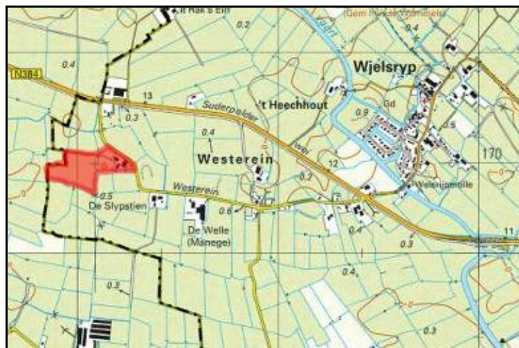
Figuur 1 Ligging perceel Westerein 33 te Wjelsryp

Deze ruimtelijke onderbouwing is opgesteld voor het verlenen van een omgevingsvergunning in afwijking van het bestemmingsplan, met toepassing van artikel 2.12, eerste lid, onder a, onder 3 van de Wabo, voor de boogstal die is gerealiseerd op het perceel Westerein 33 te Wjelsryp. De boogstal betreft in feite alleen een overkapping in boogvorm, die geplaatst is boven een sleufsilo voor het overdekt opslaan van kuilvoer. De boogstal voldoet niet aan de regels van het bestemmingsplan Buitengebied West vanwege de dakhelling, die ontbreekt bij een boogstal. In onderstaande figuren wordt de ligging van het perceel Westerein 33 te Wjelsryp en de situering van de boogstal op het perceel weergegeven.